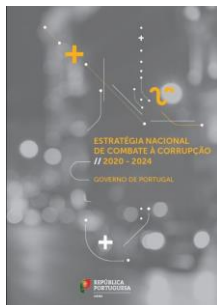
Estratégia Nacional de Combate à Corrupção 2020-2024 Governo de Portugal

A fraude e a corrupção prejudicam gravemente os negócios, a economia e a sociedade no seu conjunto, bem como, a reputação e a marca das Organizações, enfraquecem a sua boa governação e comprometem a eficiência empresarial e a leal concorrência.